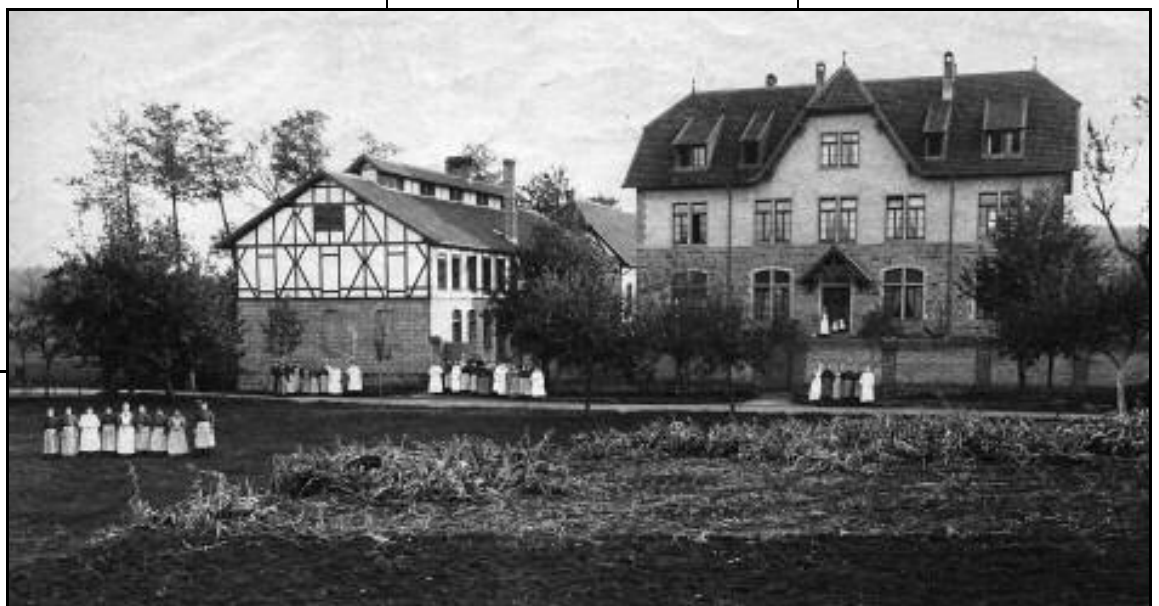
Mitarbeiterinnen und Mädchen vor dem Haus Eben-Ezer und der Wäscherei um 1907.

Jugendliche im Haus Esche, machen Hausaufgaben und erhalten differenzierte Betreuung. Es sind jetzt eine Tagesgruppe, die Gruppe für Intensive Sozialpädagogische Einzelmaßnahmen, die Familienhilfe und ein Appartement des Einzelwohnens darin untergebracht. Schon am Haus Esche wird deutlich, dass in den 100 Jahren aus dem Mädchenheim eine große und vielfältige Jugendhilfeeinrichtung geworden ist. gh