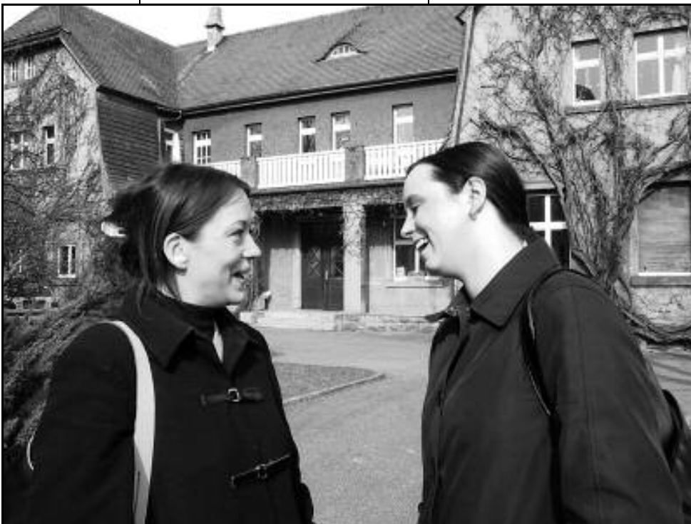
...vor dem Haus „Esche“, ihrer alten Heimat, ist immer noch gut lachen