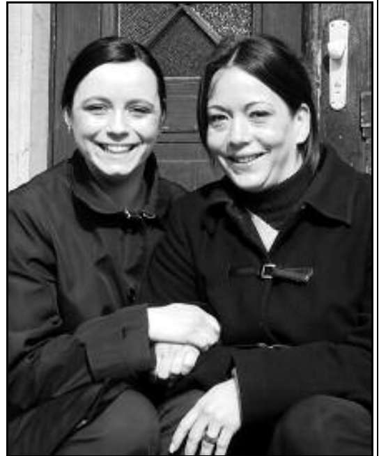
...bis heute die besten Freundinnen

D: Ich bin wahnsinnig begeistert von den Tagesgruppen. Die Zusammenarbeit klappt ganz toll und wir machen auch langsam Fortschritte mit unserem Sohn. Die Betreuungstage sind toll. In der Schule war es anfangs schwierig, aber inzwischen geht es wunderbar. Er macht mit, passt auf, ich find’s toll. Im Kindergarten hatten wir