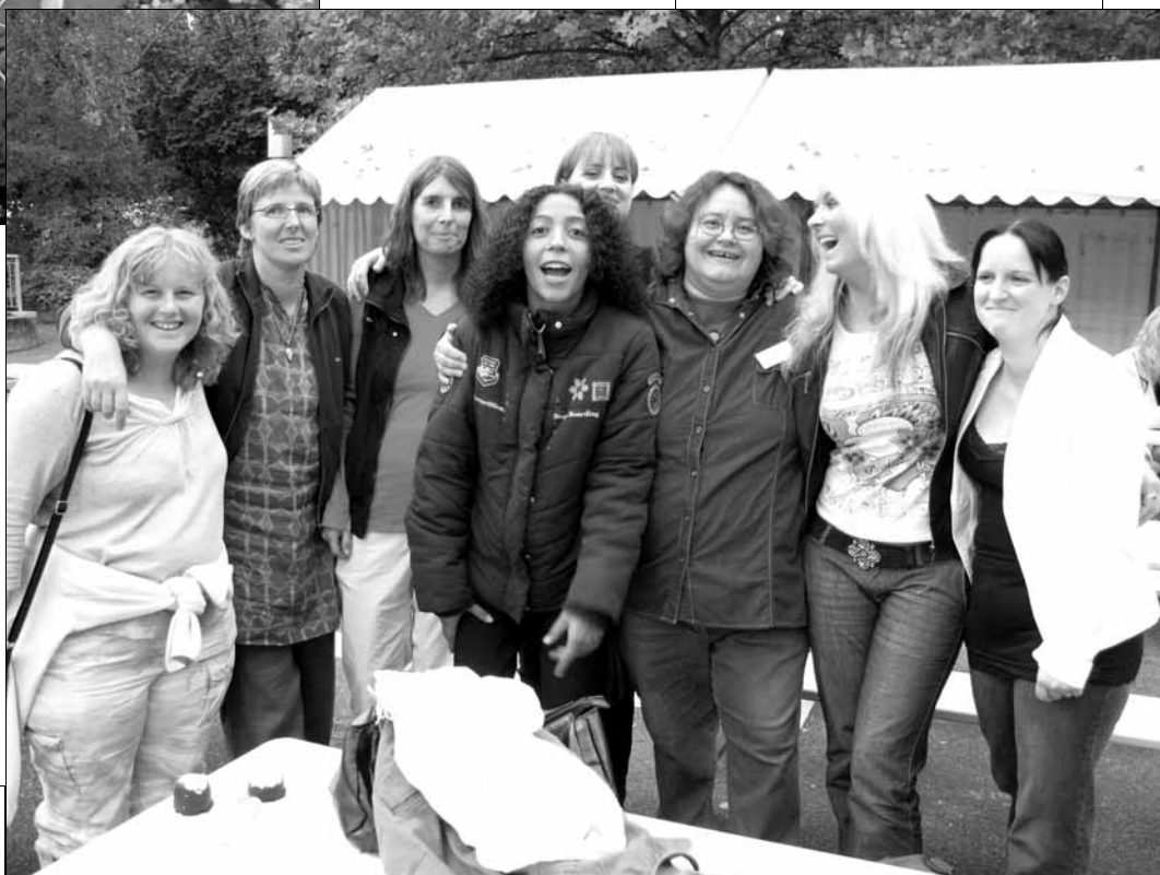
Wiedersehensfreude beim Ehemaligentreffen

Und auch für ein Dienstjubiläum war dieser Tag ein geeigneter Rahmen. Gerd