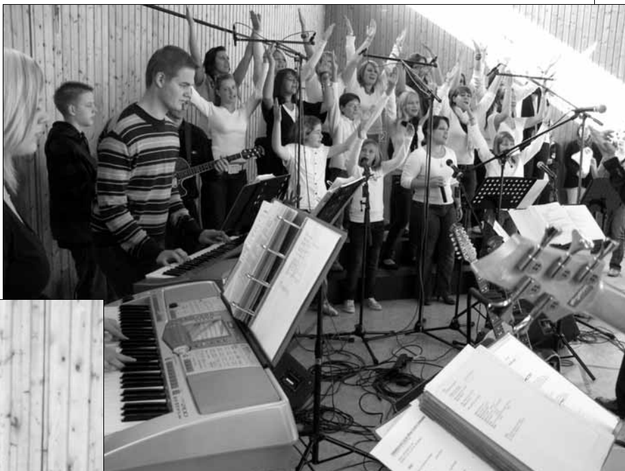
Der katholische Gospelchor „Future Stars“

Viele 'Ehemalige' waren gekommen, um alte Kontakte zu pflegen und die Hohberghausfamilie wieder einmal zu besu-